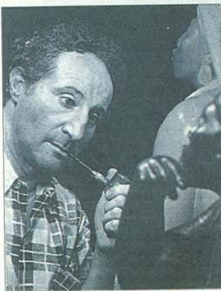
Cañas, en ple procés creatiu

S'ha obert el termini de presentació de fotografies per prendre part a l'onzena edició del Concurs de Fotografia que organitza el Museu Arqueològic del Vendrell. Hi ha temps fins el 20 de setembre per presentar unes obres que han de tenir com a fil conductor el tema Postals del Penedès . La novetat d'enguany és que el Patronat de Turisme editarà les guanyadores com a postal oficial del municipi.