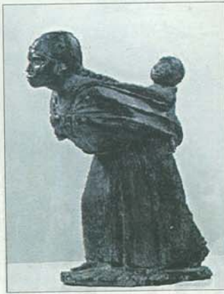
DIARI La dolça càrrega, primera obra a Mèxic