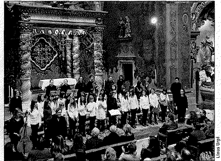
El cor de veus blanques de l'Escola Municipal de Música Pau Casals del Vendrell i el grup Ço del Botafoc, dilluns a l'església del Vendrell

L'acte va acabar amb una actuació sardanista dels Joves Dansaires del Penedès, els quals van haver de ballar dins de la Sala Polivalent de la Vil·la Casals per les males condicions climatolò-