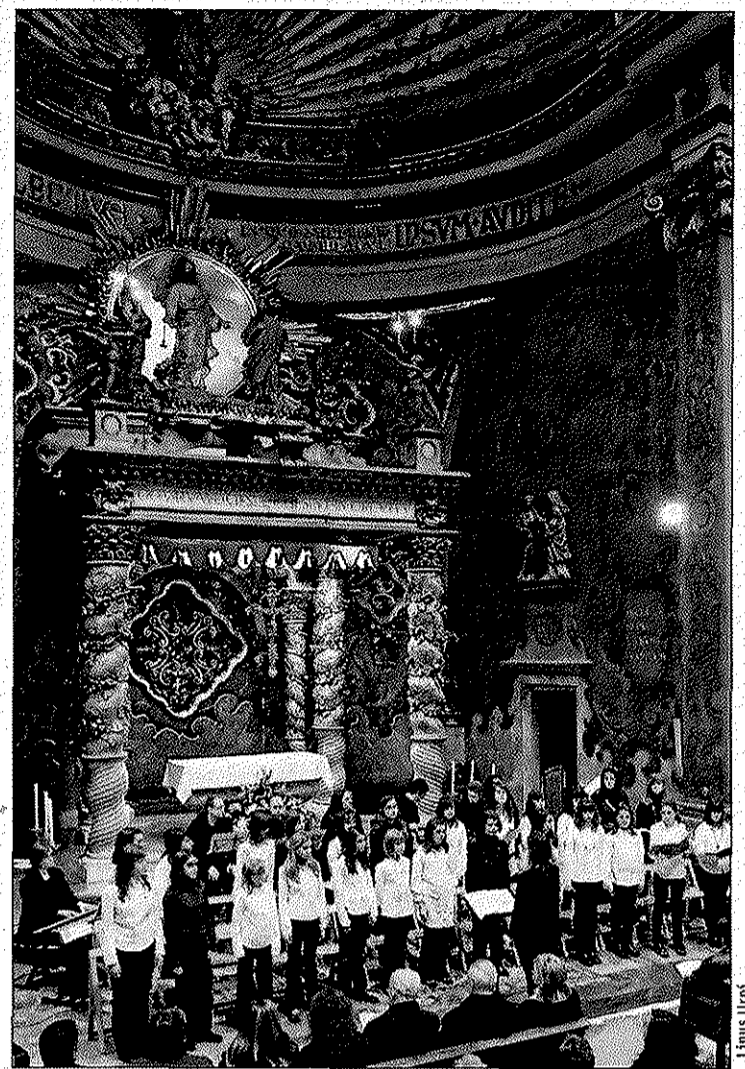
El concert va omplir l'església parroquial del Vendrell

Concert a la plaça de Pi i Margall de l'orquestra Pau Casals, sota la seva direcció. Van interpretar l'Obertura 'Leonora' número 3 de Beethoven; la sardana