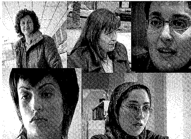
Les cinc dones dels perfils que apareixen al programa