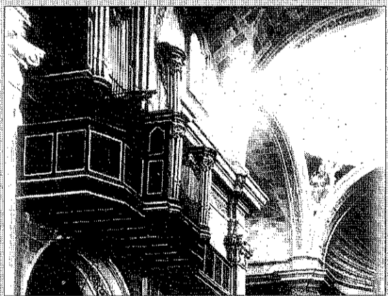
Ubicació original de l'orgue