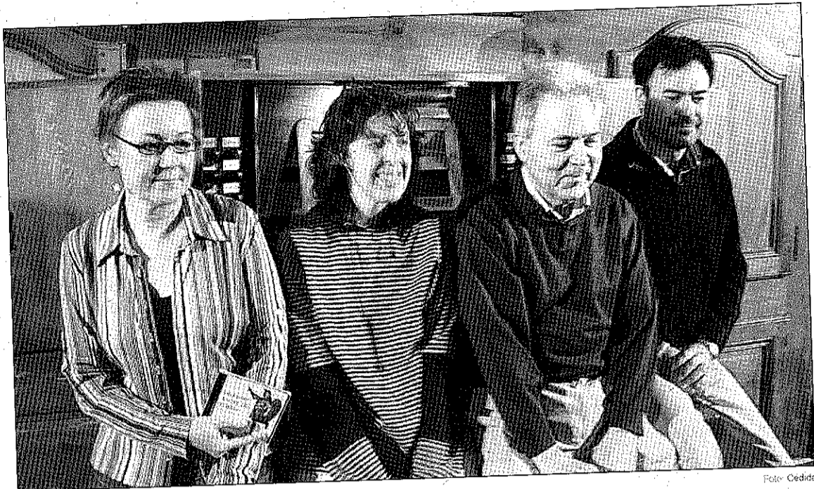
Els membres que han fet el CD