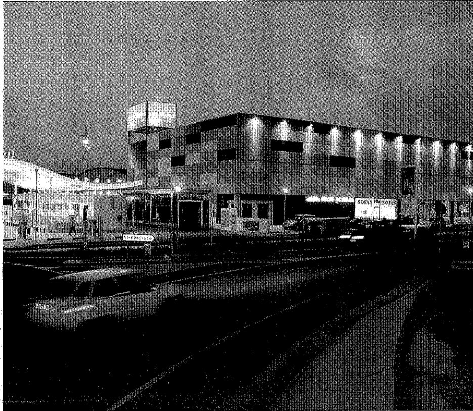
Les Mates recupera l'oferta de discoteca fins la matinada

La nova discoteca, doncs, va adreçada a majors d'edat, i estarà oberta divendres i dissabtes. Segons els promotors a partir de novembre obriran les tardes dels diumenges, per a clientela més jove.